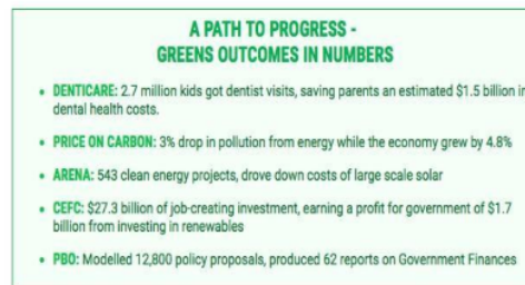
Gambar 2. penggunaan teknik propaganda card callingoleh partai hijau

Card Stacking, Card stacking adalah teknik di mana informasi yang disajikan kepada publik diatur sedemikian rupa untuk menonjolkan hal-hal positif dari suatu ide atau kebijakan dengan mengabaikan atau meminimalkan informasi yang negatif. Lasswell menyebut teknik ini sebagai upaya untuk mengontrol narasi dan menciptakan persepsi yang sangat menguntungkan bagi pembawa pesan (Lasswell, 1927). Contoh gambar teknik propaganda card stacking yang dilakukan oleh Partai Hijau dengan cara menyebarkan data keberhasilan yang telah dicapai maupun yang belum tercapai tetapi memiliki dampak positif bisa dilihat seperti berikut: